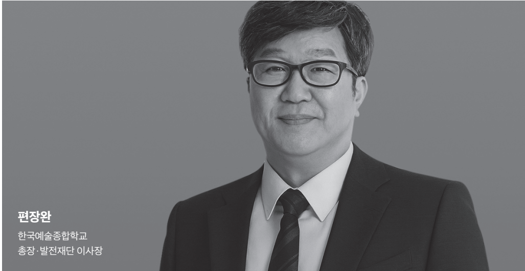
편장완 한국예술종합학교 총장·발전재단 이사장