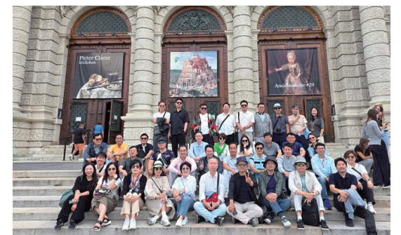
오스트리아·독일 _ 예술의 길, 유럽을 걷다