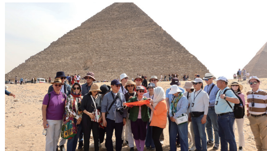
post CAP 해외답사_ 나일강을 따라가는 이집트