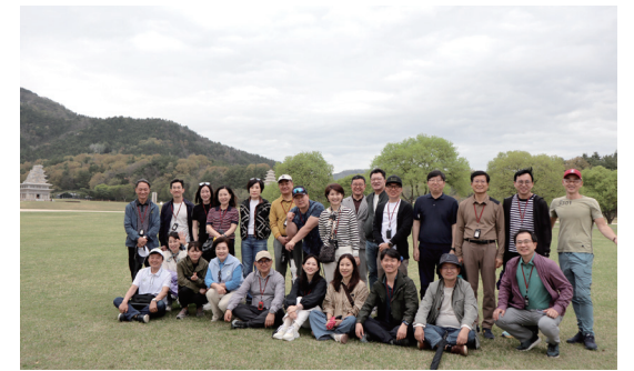
공주·부여 _ 백제의 재발견